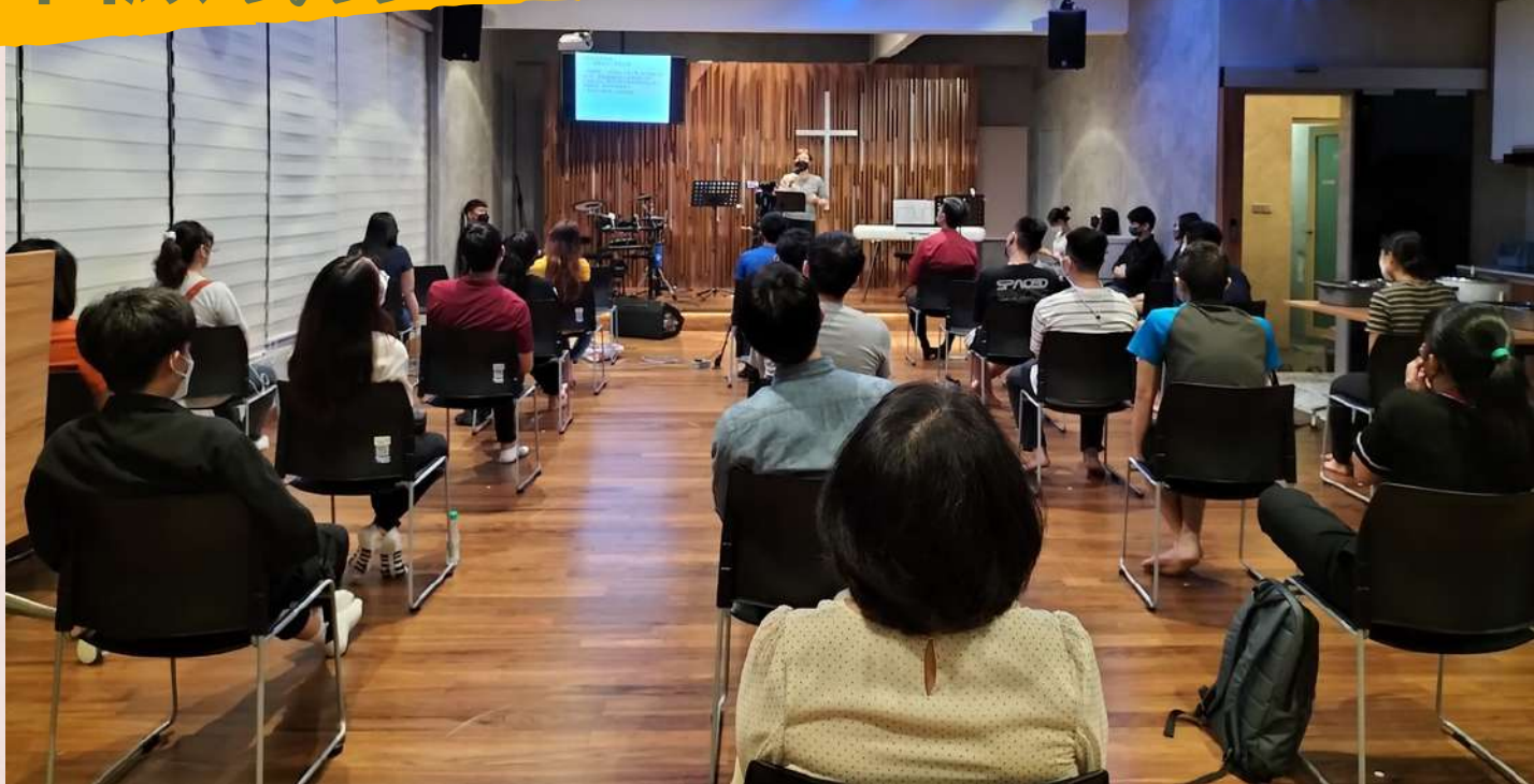
Mega Subang Chinese Methodist Church