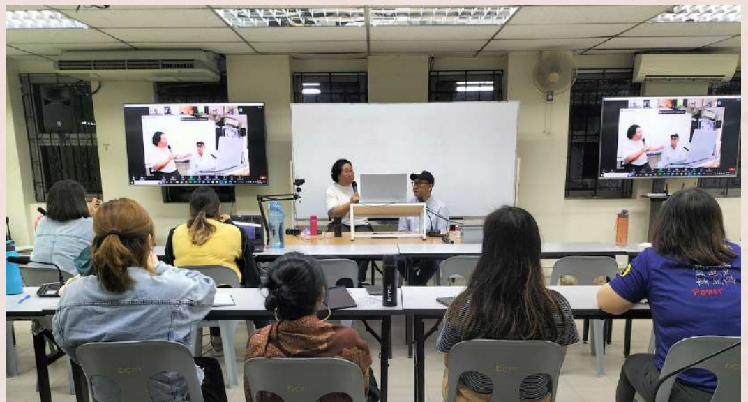
Bible College of Malaysia