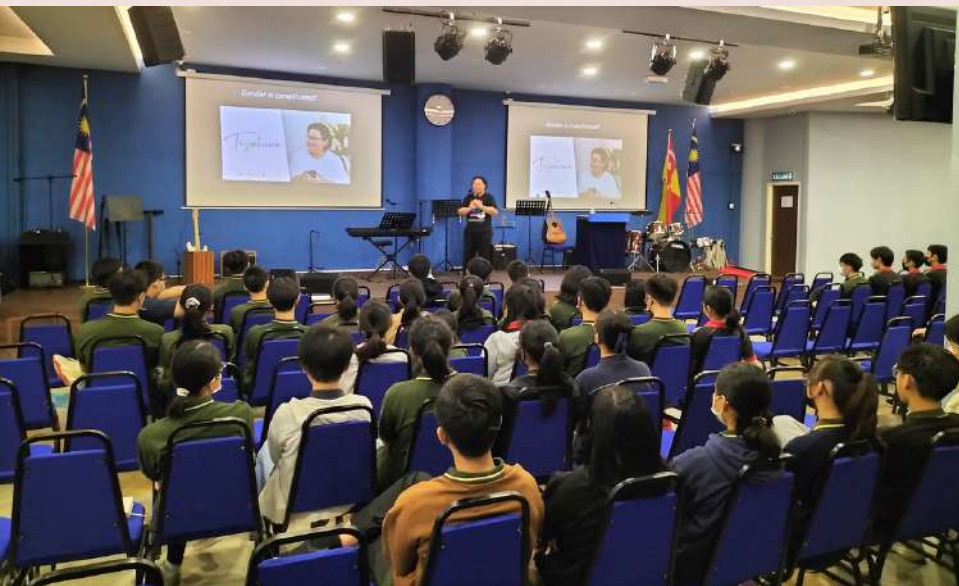
Arrows International School