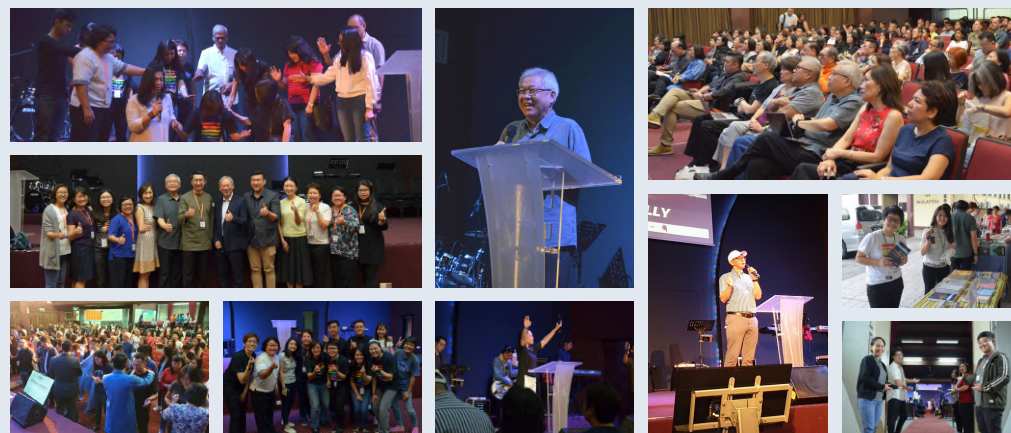
Come Out & Come Home 研讨会